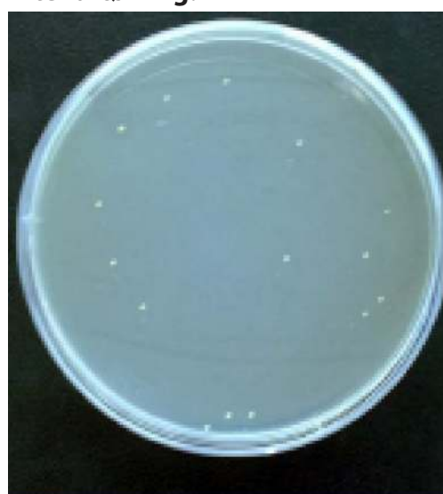
Bakterie Gule stafylokokker

Udregning af kludens evne til at opsamle bakterier og mikroorganismer: