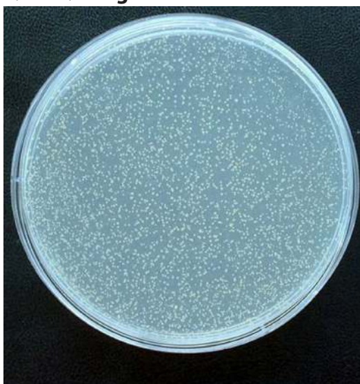
Bakterie Gule stafylokokker