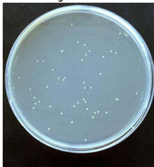
Bakterie Gule stafylokokker

Udregning af moppens evne til at opsamle bakterier og mikroorganismer: