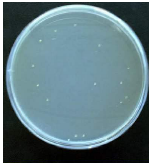
Bakterie Gule stafylokokker

Udregning af kludens evne til at opsamle bakterier og mikroorganismer: